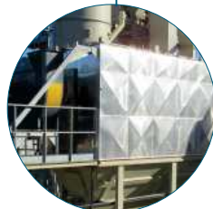
Baghouse filter with coarse fines separator Filtre à manches avec pré-séparateur