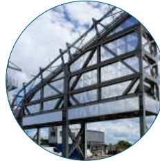
Beside Asphalt Silo Silo Lateral d'Enrobé