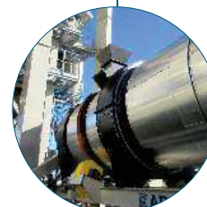
Counterflow drum dryer Sécheur Contre-courant