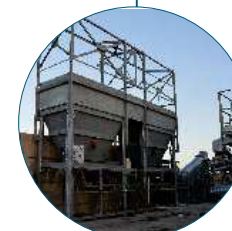
Recycling System - RAP Système Recyclage - RAP