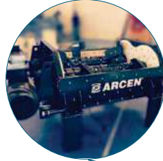
Asphalt shaft mixer Malaxeur d'Enrobé